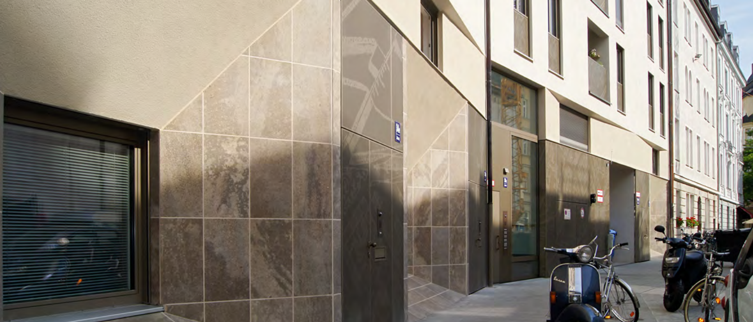
Außergewöhnliche Fassadenansicht inmitten klassischer Altbauten – das Jahn 34 mit seinen prägnanten, mit Natursteinbelag verkleideten Trichtern